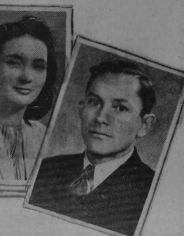
HERNANDEZ PIEDRA Y DON