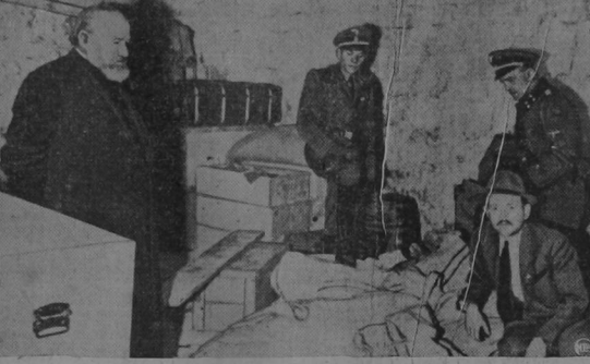
Un clero yugoslavo contempla en silencio el saqueo de los tesoros, sagrados confiados a su cargo, mientras dos oficiales nazis examinan el botín

Esto es la forma como obtienen el combustible los patriotas yugoslavos, para poder manejar sus pocos tanques y automóviles